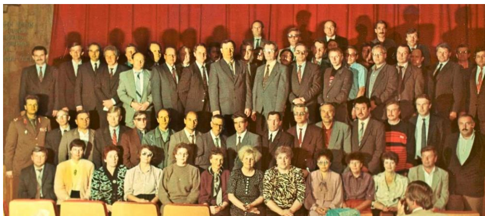
Первый состав Совета судей РФ.

Участвовали в работе I Всероссийского съезда судей 539 делегатов. На съезде присутствовал Президент РСФСР Б.Н. Ельцин, который в своем выступлении отметил: «Нам нужен суд, а не удобное правосудие... Без признания высшей юрисдикции в суде в рамках его компетенции не сможет состояться государственность России. Без сильной и независимой судебной власти не будет действительно сильной и эффективной законодательной и исполнительной власти в Российской Федерации».